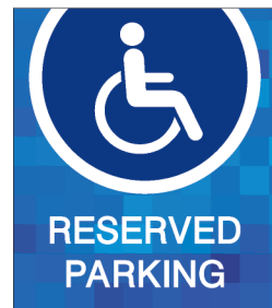
Reserved TR10X11,5-A 10.0"w X 11.5"h