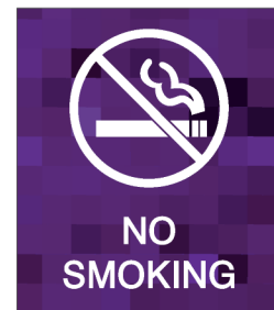
No Smoking TR10X11,5-A 10.0"w X 11.5"h