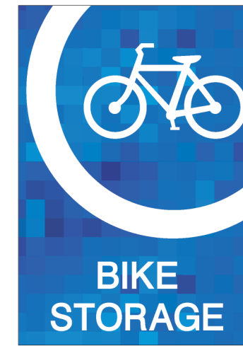
Zone TR14X20-A 14.0"w X 20.0"h