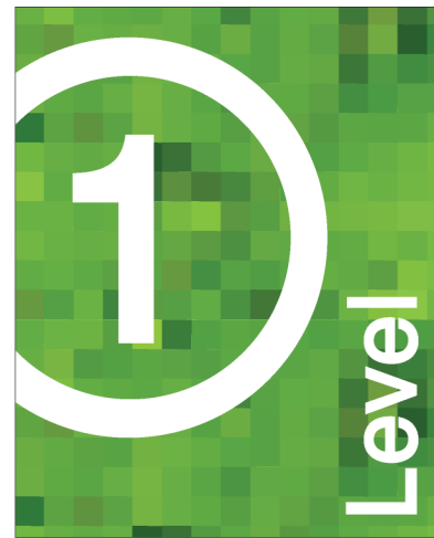
Level ID TR16X20-A 16.0"w X 20.0"h