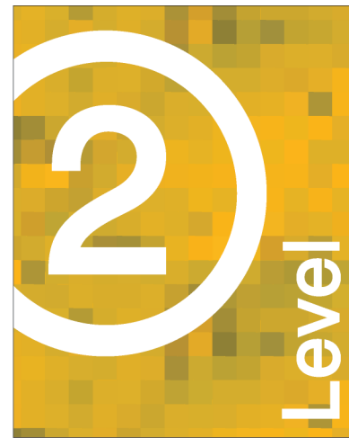
Level ID TR16X20-A 16.0"w X 20.0"h