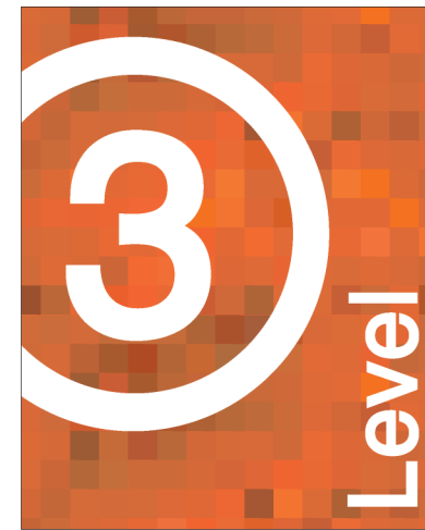
Level ID TR16X20-A 16.0"w X 20.0"h