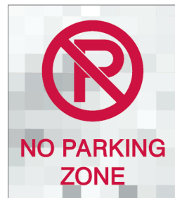
Restricted TR10X11,5-A 10.0"w X 11.5"h