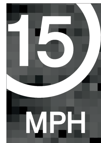
Limit TR14X20-A 14.0"w X 20.0"h