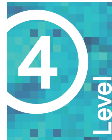
Level ID TR16X20-A 16.0"w X 20.0"h